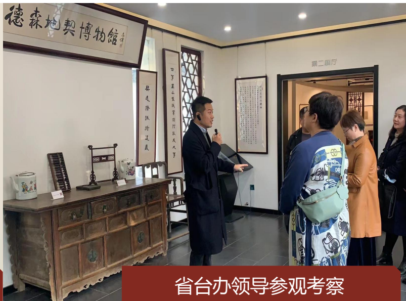
省台办领导参观考察