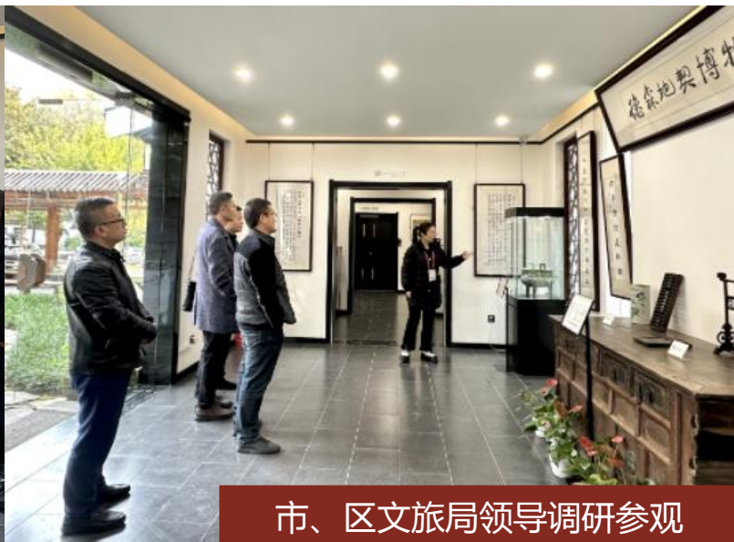
市、区文旅局领导调研参观