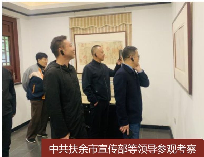
中共扶余市委宣传部等领导参观考察