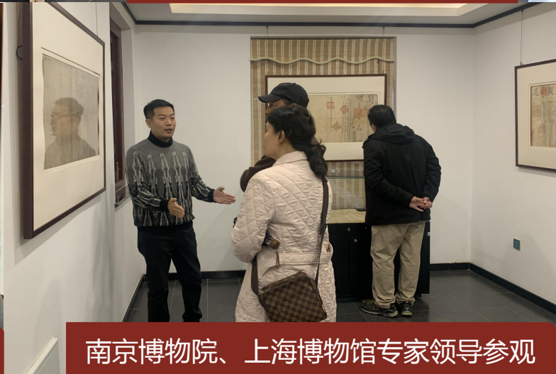
南京博物院、上海博物馆专家领导参观