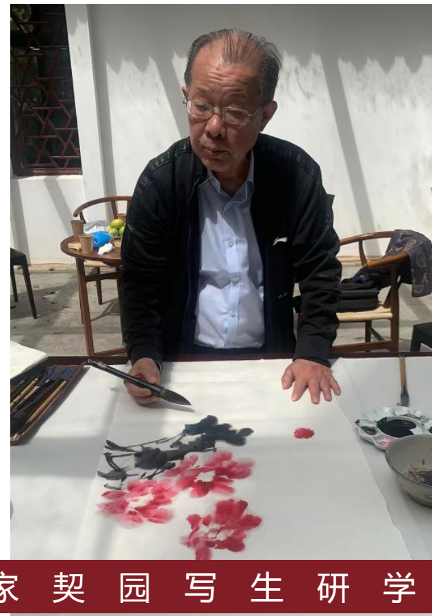
书画家契园写生研学