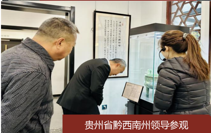
贵州省黔西南州领导参观