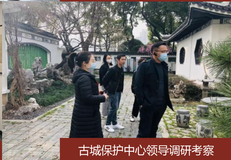
古城保护中心领导调研考察