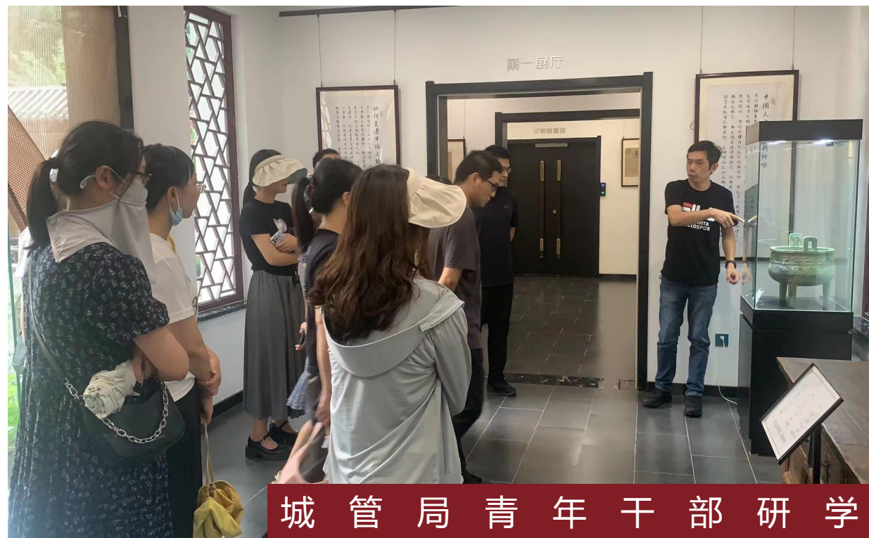
城管局青年干部研学