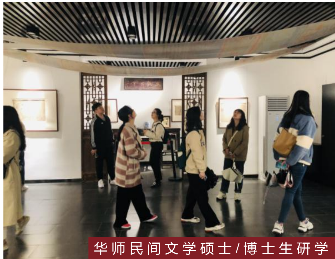
华师民间文学硕士/博士生研学